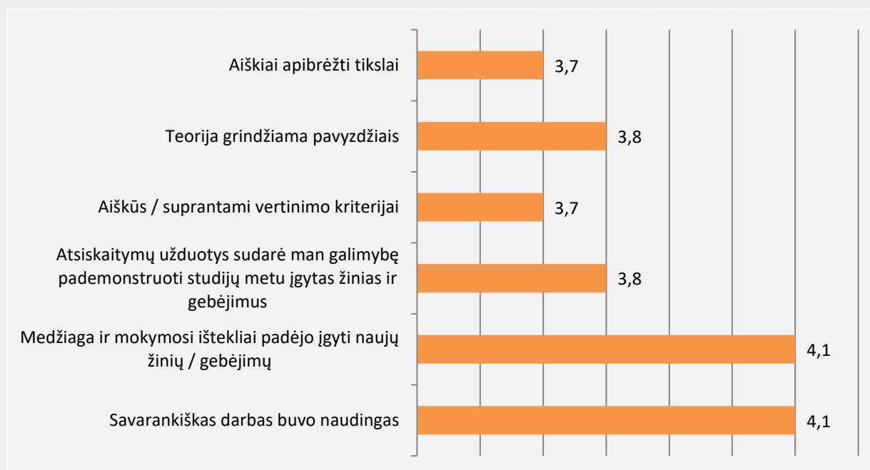
1 pav. Įvaizdžio dizaino studijų programos studijų dalykų turinio kokybės vertinimas (vidurkiai)

Studentai studijų dalykų turinio kokybę vertino 74 proc. Vertinimo vidurkis pagal visus kriterijus (žr. 1 pav.) svyruoja nuo 3,7 iki 4,1 balo. Bendrai studentai dalykų turinio kokybę vertino gerai. Aukščiausiai studentai vertino tai, kad medžiaga ir mokymosi išteklių padėjo įgyti naujų žinių / gebėjimų bei savarankiškas darbas buvo naudingas. Savo įdėtas pastangas studijuojant studentai vertino 8,9 balais iš 10.